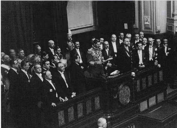
Regele Carol al II-lea la deschiderea sesiunii parlamentare alături de guvern, Principele Nicolae și Marele Voevod de Alba-Iulia.