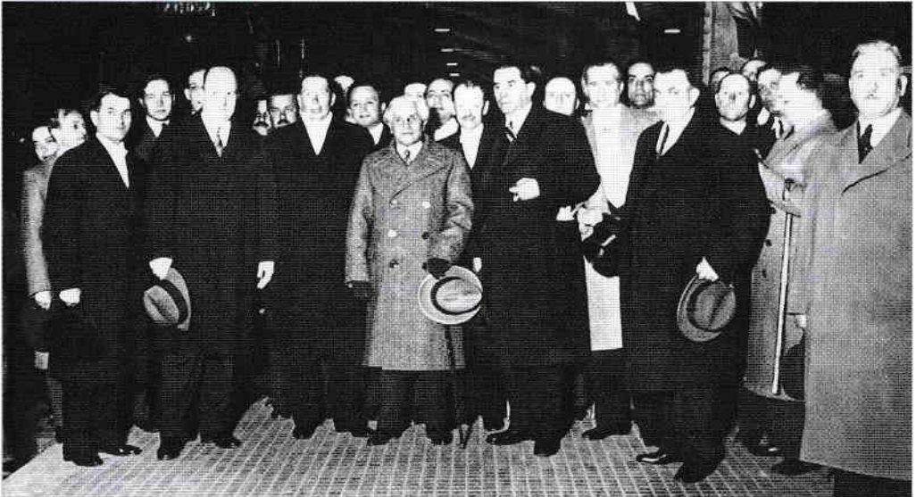
Joseph Paul-Boncour la București, alături de Gh. Tătărescu, Nicolae Titulescu, Ion Inculeț, Nicolae Raicoviceanu.