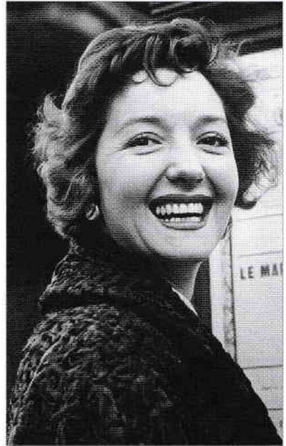
Zizi Lambrino în anii 1930, la Paris.