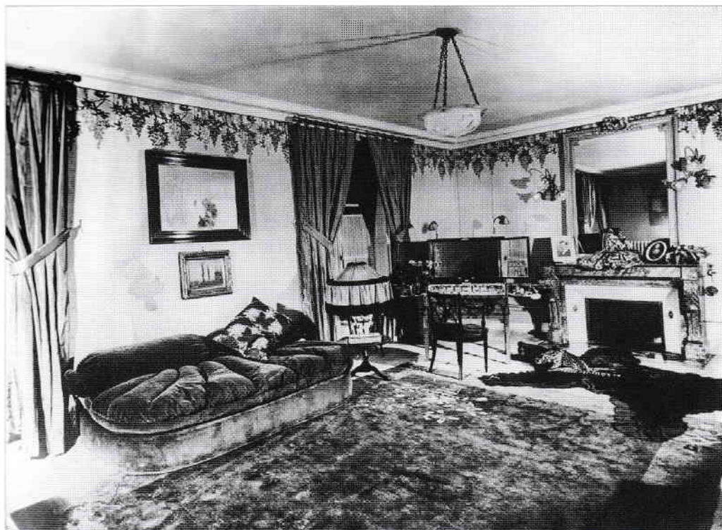
Interior al vilei din Franța, unde Carol Caraiman (numele din exil al principelui) și Elena Lupescu au locuit în perioada 1928–1930.