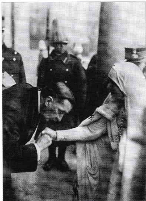
Iuliu Maniu și profundul său respect pentru Regina Maria.