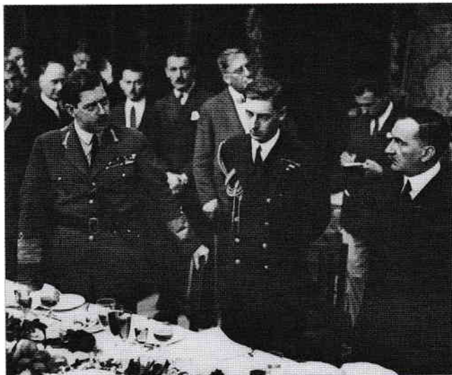
Carol al II-lea, Principele Nicolae și Iuliu Maniu la un dineu oficial.