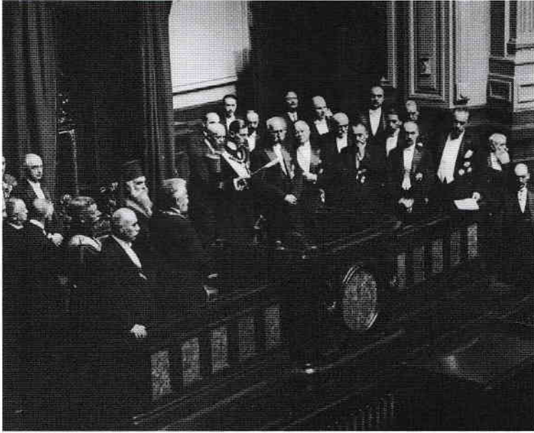
Principele Regent Nicolae citește mesajul de deschidere a Parlamentului.